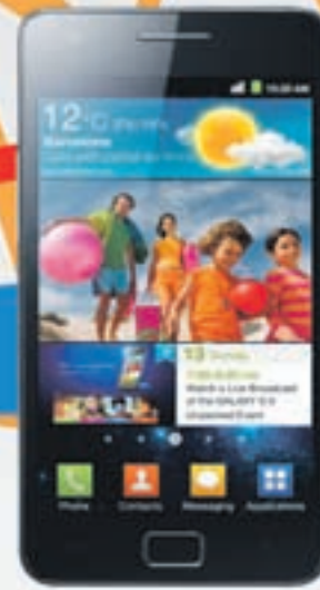
Samsung Galaxy S2 Afl 1.499